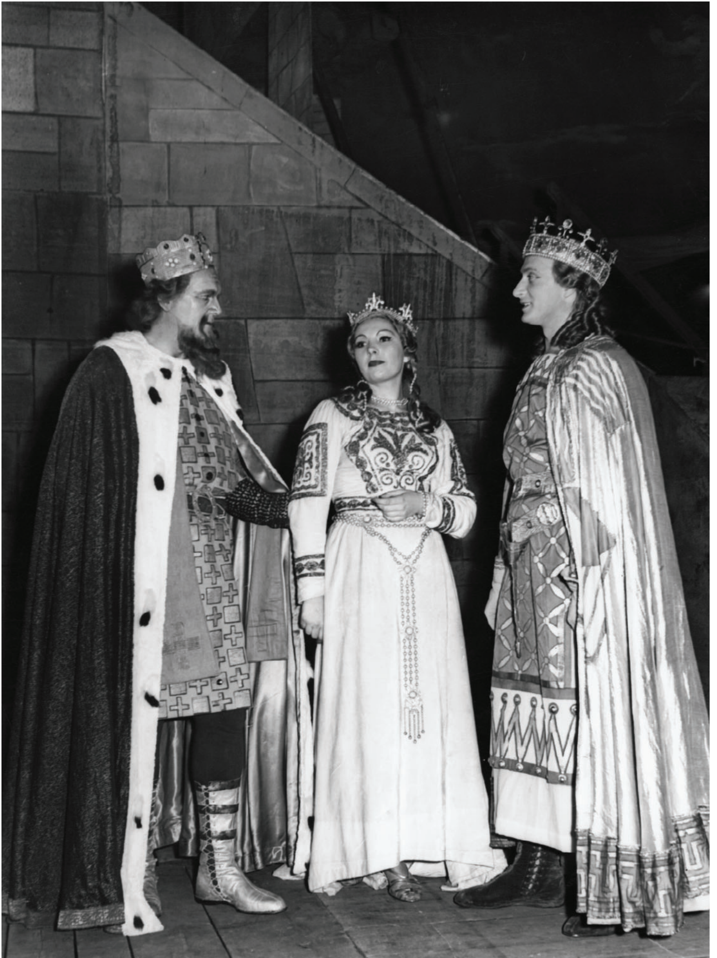
1949-07 - Lohengrin - Richard Wagner - Elsa di Brabante/Debutto - Roma - Terme di Caracalla