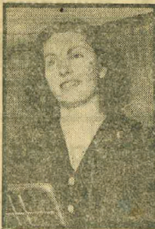
ROXANA CARTERI Soprano lírica.

Los últimos ensayos han sido magníficos. La Orquesta del Conservatorio suena magníficamente; el quinteto de cantantes es, sin género de duda, el más completo que pueda formarse y digno de un teatro de la categoría de la Scala de Milán.