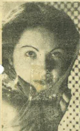
La giovanissima Rosanna Carteri che interpreta la parte di Micaela nell'attuale edizione della «Carmen» al Verdi.